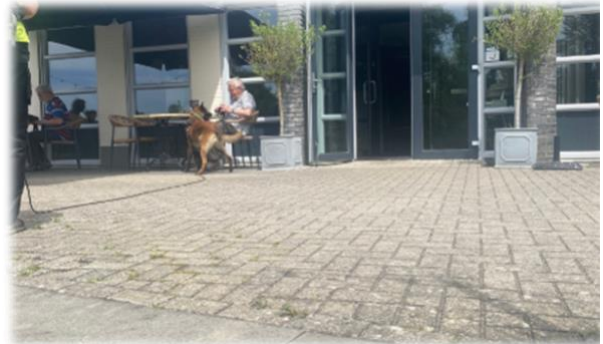
Runner voor Izar aan een koud biertje (0.0) op het heetste plekje van Bredevoort. Pfff wat een hitte