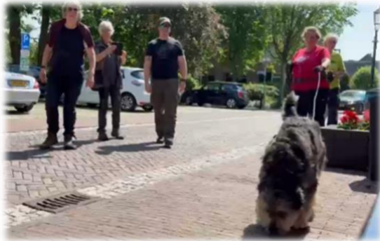
Sam bijna bij de runner (die ons filmde), die lekker op het terras zat. En wij maar zweten...